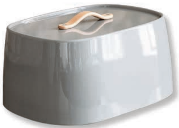
Nordisch versorgt Hochglanzlackierter Stahl, der Griff aus Buchenholz: Der Brotkasten «Emma» ist für Fans des skandinavischen Designs. Gesehen bei torquato.ch