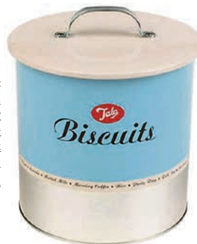
Hübsch gelagert Ideal für die Aufbewahrung von Guetzli oder Muffins: Dank ihrer dekorativen Optik muss die Blechdose nicht im Schrank versorgt werden. Gesehen bei Interio