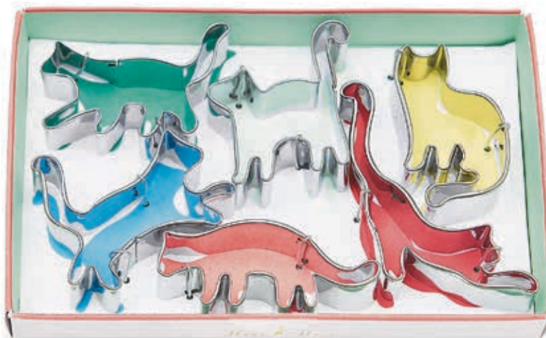
Naschkatzen Wer sagt denn, dass Guetzli sternförmig ausgestochen werden müssen? Diese Katzenfamilie haart garantiert nicht. Gesehen bei Möbel Pfister