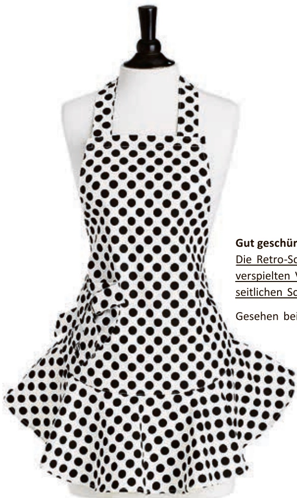
Gut geschürzt ist halb gebacken Die Retro-Schürze punktet mit verspielten Volants und einer seitlichen Schleife. Gesehen bei minischoggi.ch